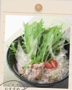
りん先生おすすめ！モロヘイヤ菜

5月は気温が上がり始めるものの、冬に溜まった冷えが体から抜けきれずにいると、疲れやすさなどの不調が出やすくなります。さらに、湿気が増えてくることで、重だるさを感じる方も多いかもしれません。そこで、エネルギーを補い、温活にも良い薬膳ラーメンを考案しました!