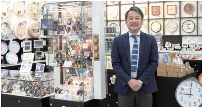
ニシムタ与次郎店新館2階 Tel 099-255-7244 営業時間/ 9:00~19:00 年中無休