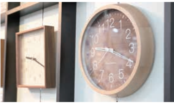
おすすめは、岐阜県の木材加工会社「加藤木工株式会社」が手掛ける、木製の掛け時計