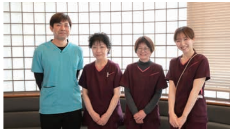
優しい笑顔でお出迎え。アットホームな雰囲気も魅力

地域の“かかりつけ医”として、どんな症状であっても気軽に相談してもらえる存在になれたらと思っています。