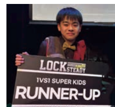
息さんは今年1月、韓国のソウルで開催されたアジア大会で準優勝されました！

体調の変化や気になることがあれば、「こんなことで受診していいのかな？」と思わず、ぜひ気軽にクリニックを訪れてみてください。健診のご相談も、もちろん大歓迎です。